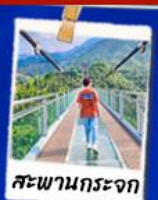
สะพานกระจก