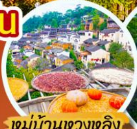
หมู่บ้านหวงหลิง