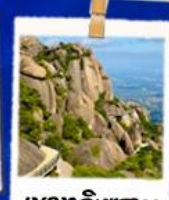
เขาหลิงชาน