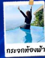
กระจกห้องฟ้า