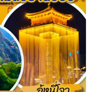
อุ้งนี้ใจ

เมนูพิเศษ !! อิ่มอร่อยกับบุฟเฟ่ต์ชาบู และ ปิ้งย่าง พร้อมเครื่องดื่ม