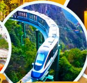
นั่งรถไฟรมพา